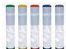
Außenhülle in Wunschfarbe