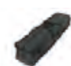
Universal Trans- porttasche