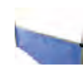
Querträger halb- hohe Seitenwand