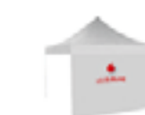
Logoaufdruck 100 x 25 cm