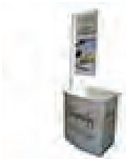
Fahnenstange inkl. bedruckte Fahne